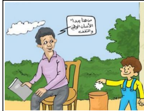
مشروع أذنّ واعية / كلية طب الزهراء