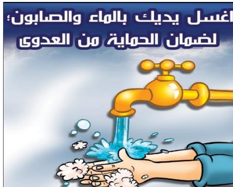
مشروع أذنّ واعية / كلية طب الزهراء