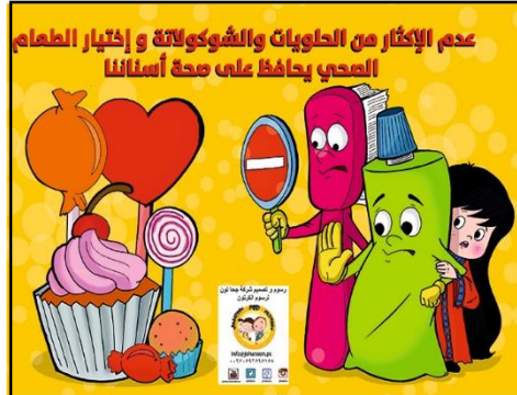
مشروع أذنّ واعية / كلية طب الزهراء